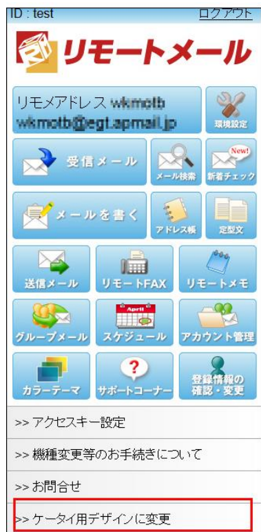
通常のスマートフォン版画面