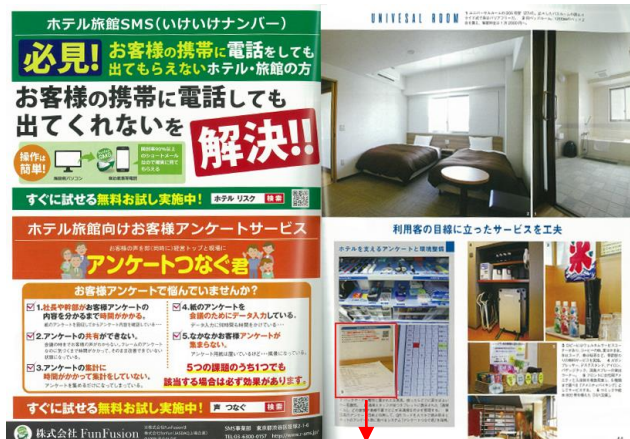
45 ページ: サービス広告