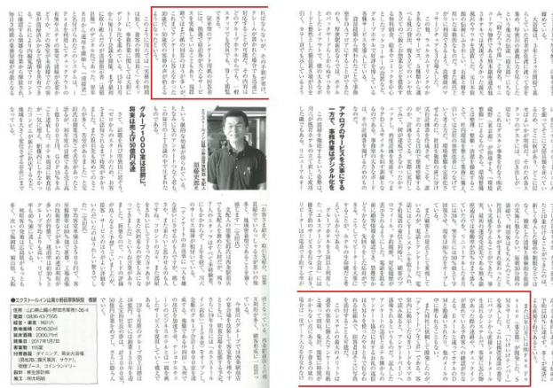
80、81 ページ: エクストールイン山陽小野田厚狭駅前 様でのサービス活用方法の紹介